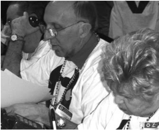
Los voluntarios en acción, lograron brillantes resultados.