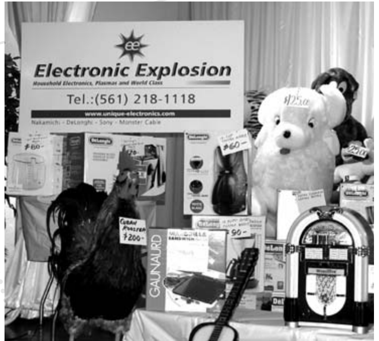
Hubo hermosos premios como recompensa para los ganadores