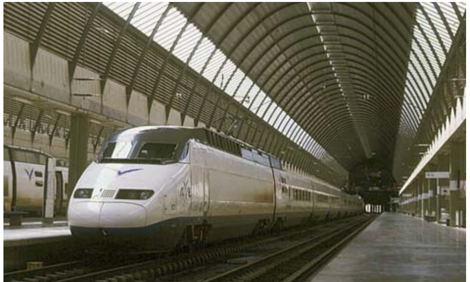
ABAJO El AVE, segundo objetivo del terrorismo que fuera descubierto horas antes de producirse el desastre.

De ahí surge el debate del tema del fundamentalismo islámico. Porque hay que decir algo importante: el problema del fundamentalismo islámico no sólo es en Pakistán, en Qatar Sudán, o en los Emiratos Arabes. Se está dando en comunidades musulmanas europeas. Yo no hablo de los ciudadanos de religión musulmana, que para mí son absolutamente respetables. Yo hablo de la ideología totalitaria