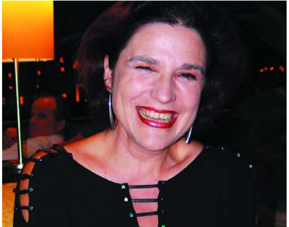
ARRIBA Pilar Rahola en un descanso de la conferencia que dió en Miami.

Publicación para la Comunidad Judía de Habla Hispana del Sur de la Florida